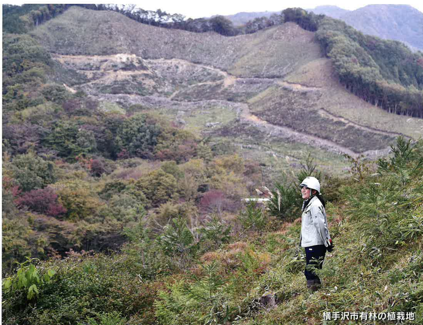
横手沢市有林の植栽地

編集・発行／日光市森林組合〔栃木県日光市瀬川51-12 電話 0288-21-0119(代)〕